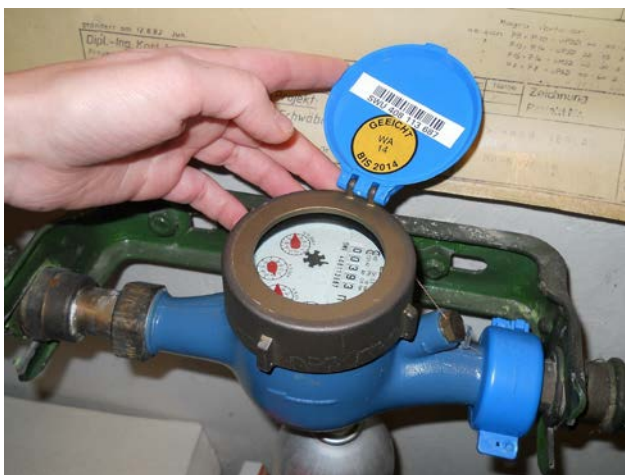
Bitte das Eichjahr beachten!